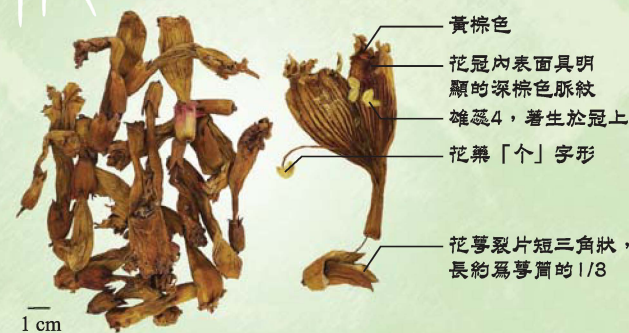
凌霄花(美洲凌霄)(不含莨菪烷類生物鹼) 屬《中醫藥條例》附表2中藥材