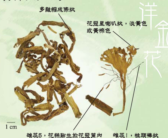
洋金花(含莨菪烷類生物鹼) 屬《中醫藥條例》附表1中藥材

香港曾發生過誤將有毒的洋金花當成無毒的凌霄花，服用後導致中毒的個案。其實，洋金花與凌霄花在來源、藥性、用途及功效等方面都不同，但在外觀上相似，容易混淆，可參考以下資料以作識別：