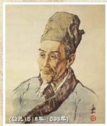
蔣兆和先生繪製的李時珍畫像

第三個階段：留萬世言。 在當時的社會，以李時珍個人的地位或財力都無法支撐190萬字的恢弘巨著的刊行。為了出版《本草綱目》，李時珍年屆古稀，仍四處奔波，直至找到當時的文學及史學家王世貞。“願乞一言，以托不朽”，這句話便是李時珍對出版《本草綱目》無奈的吶喊以及對出版的期盼。